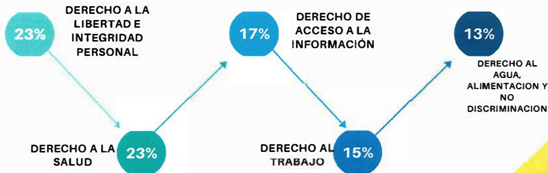
Casos recibidos porcentajes

Finalmente, en cuanto al derecho a la no discriminación se han reportado actos intimidatorios contra personas lgbti en CCC y durante procedimientos policiales, así como en la reiterada negativa de gestión para que personas varadas en distintos países puedan retornar a El Salvador.